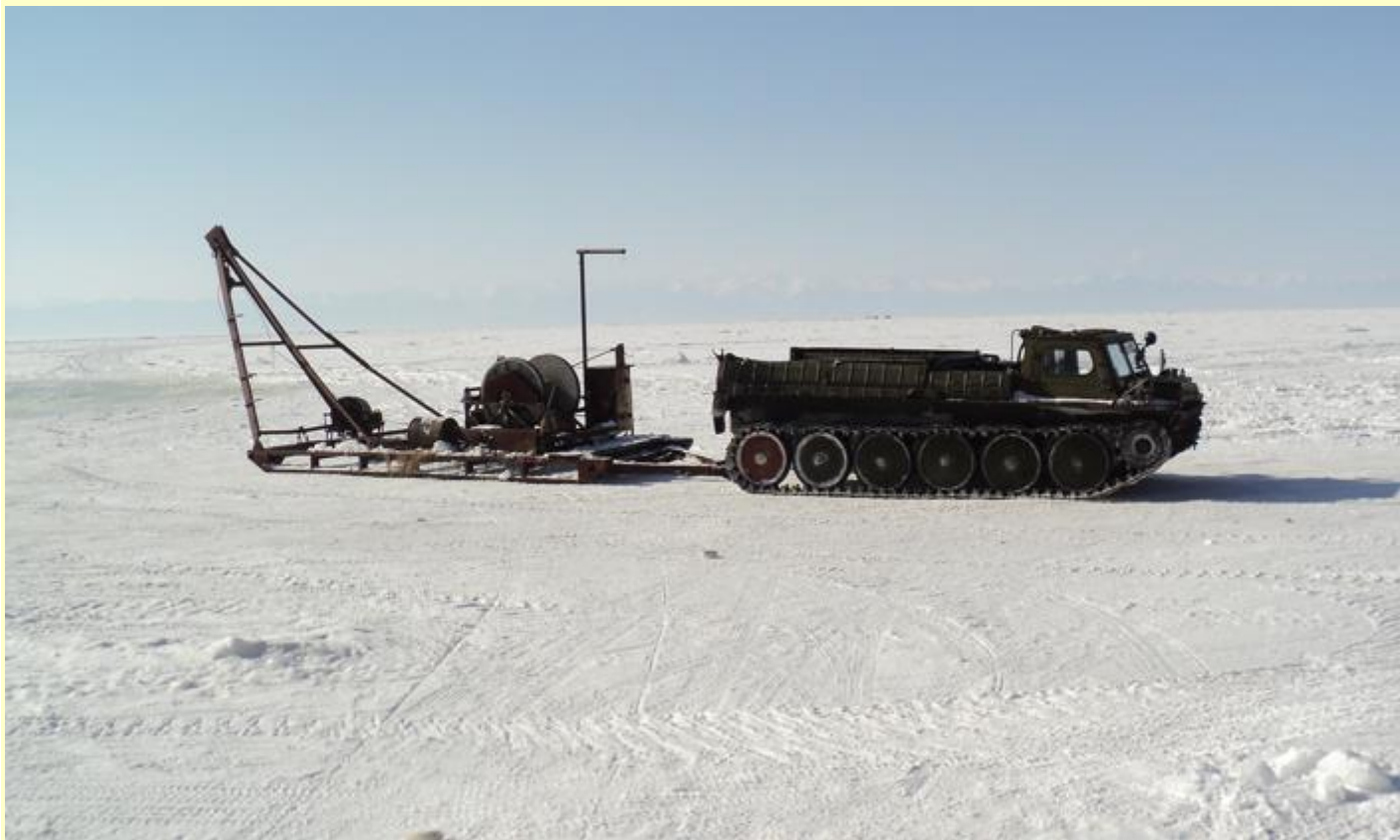
Транспортировка лебедок в ледовый лагерь для установки гирлянд ОМ

необходимость создания нейтринных телескопов близкой мощности в Северном полушарии с тем, чтобы вести исследование источников нейтрино высоких энергий по всей небесной сфере. ОИЯИ, уже имеющий многолетний опыт участия в байкальском нейтринном проекте, принял решение рассматривать работу по созданию крупномасштабного нейтринного телескопа ВАИКАЛ-GVD в качестве одного из своих научных приоритетов."